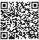
【図】納税通知書等の電子的送付（イメージ）